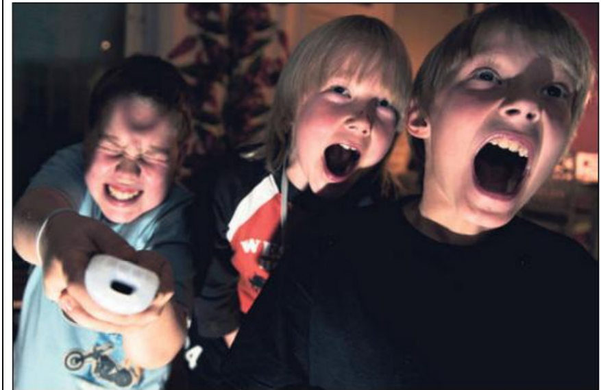
Aikuisten pitäisi valvoa entistä tarkemmin lastensa pelaamista.

Nyt se on ensimmäistä kertaa todistettu: jos peleissä on väkivaltaista sisältöä, pelaajista tulee aggressiivisempia.