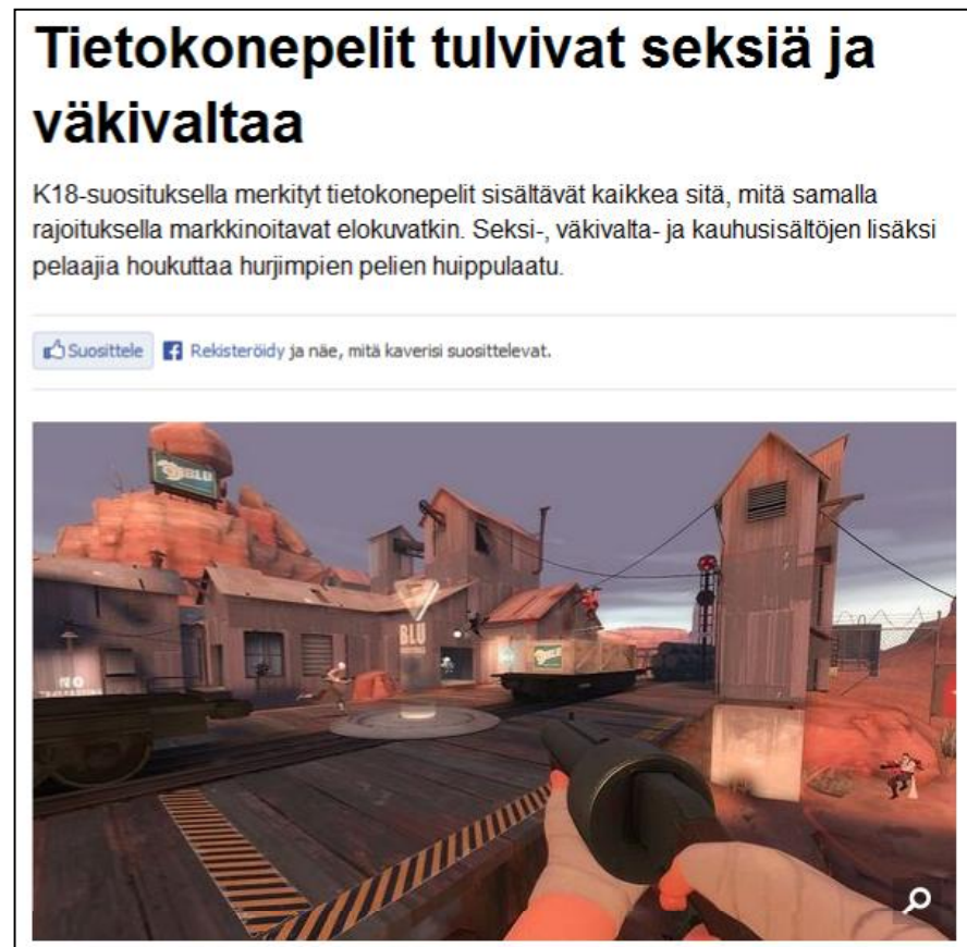
Kuva 5. K18-pelien seksiä, kauhua ja väkivaltaa käsittelevä artikkeli käytti kuvituksena PEGI 16 -peliä Team Fortress 2 (2007) (Yle 17.11.2011).

Yksittäisten artikkelien kohdalla nostettiin esiin yhä klassisia väkivaltaisten pelien arkkityyppejä, kuten Mortal Kombat (1992) ja Doom (1993), mutta pääasiallisesti niiden paikan olivat ottaneet uudet arkkityypit. Sekä tekstissä että kuvituksessa esiintyivät usein Grand Theft Auto , Battlefield ja Call of Duty -pelisarjat. Aineisto huomioon ottaen tämä olikin odotettavissa. Lisäksi mainittiin